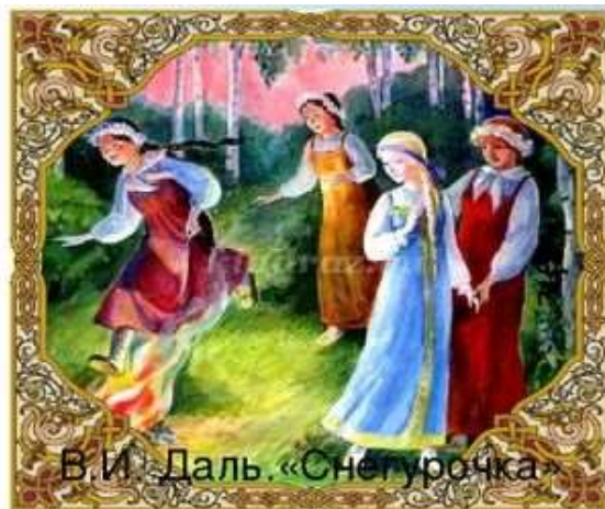
В.И. Даль. «Снегурочка»

Сказка о созданной из снега доброй и красивой девушке с грустным концом.