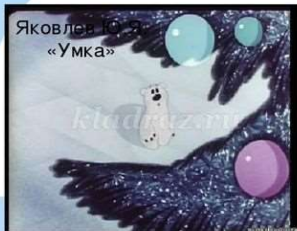
Яковлев Ю. Я. «Умка»

Главный герой этой истории, с красивым северным сиянием, который познакомился с мальчиком. хотел ходить в шапке и на задних лапах