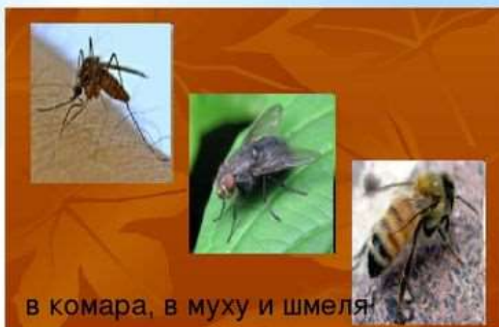
в комара, в муху и шмеля