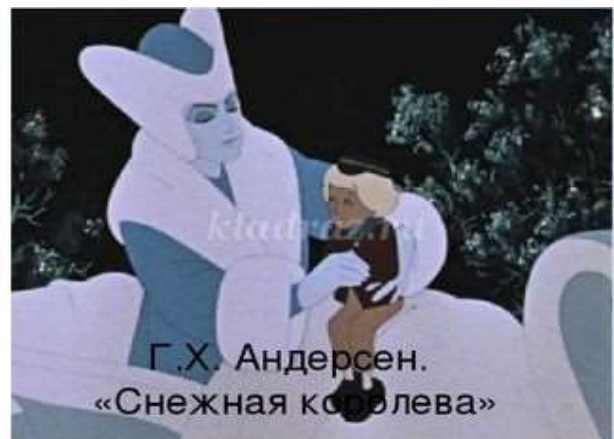
Г. Х. Андерсен. «Снежная королева»

Сказка о том, как злая королева околдовала и похитила мальчика, заставив его забыть о своей семье, и лишь любовь девочки способна была спасти его из ледяного плена.