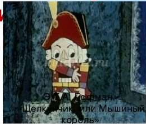
Э. А. Гофман. «Щелкунчик или Мышиный король»

Чудесная история о том, как найти подснежники в январе, как зима может превратиться в лето, как злая мачеха отправила падчерицу в лес за подснежниками в зимнюю стужу, надеясь, что та не вернется из лесу.