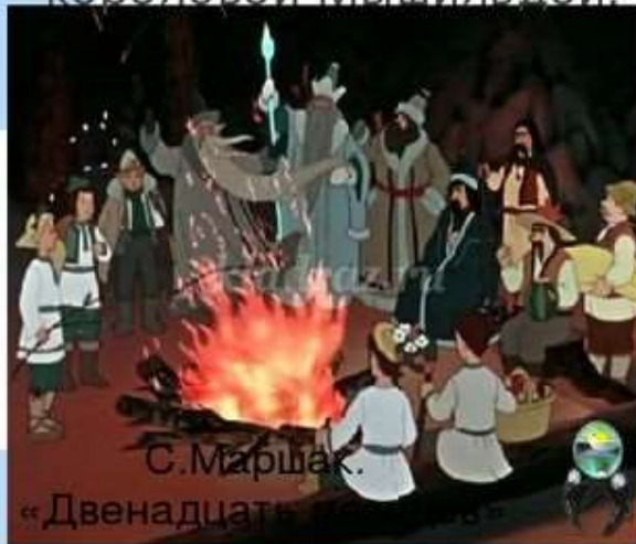
С. Маршак. «Двенадцать месяцев»

Добрая и волшебная сказка о мальчике, заколдованном злой королевой Мышьдой.