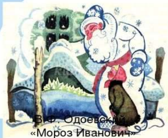
В. Ф. Одоевский. «Мороз Иванович»

Новогодняя история о том как две сестрицы Ленивица и Рукодельница по очереди хозяйничают в чужом доме, если ты ленивый, неумелый и работать не любишь, то не получишь ты ни награды, ни благодарности.