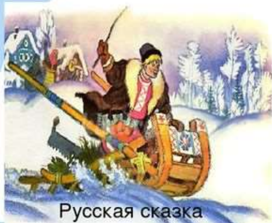
Русская сказка «По щучьему велению»

История о приключениях деревенского паренька Емели, поймавшего в проруби волшебную щуку-кудесницу.